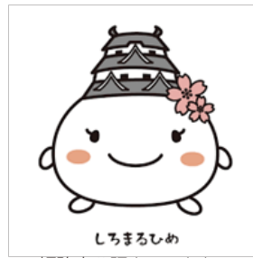
しろまるひめ 姫路市公認キャラクター